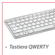
• Tastiera QWERTY