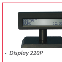
• Display 220P