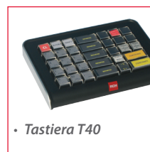
• Tastiera T40